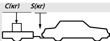
верное размещение груза