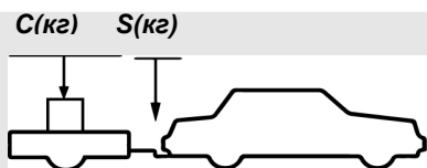
верное размещение груза