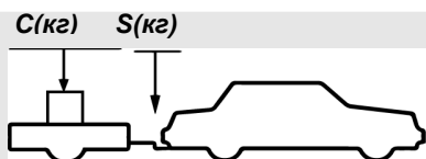
верное размещение груза